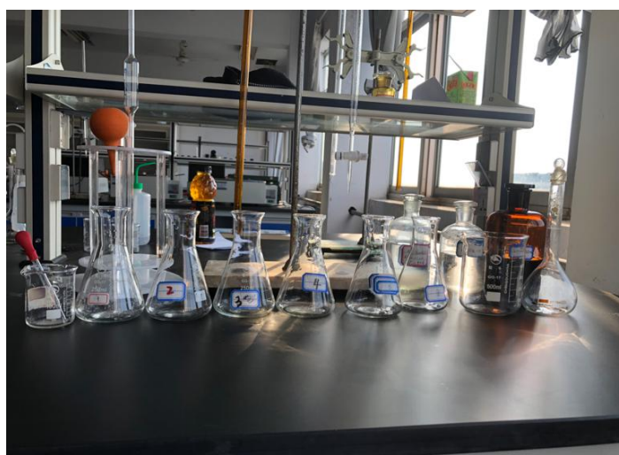
图 1 仪器准备