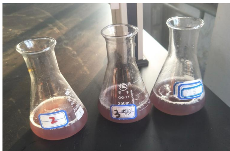
图 5 滴定终点