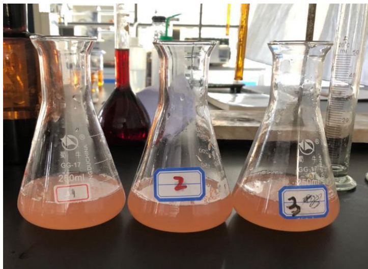
图 4 滴定前

2. 准确量取 25.00ml 碘液, 加 50ml 水, 摇匀, 用 0.1 C 的 \text{Na}_2\text{S}_2\text{O}_3 标准溶液滴定近终点 (微黄色) 时加 2ml 淀粉指示剂, 继续滴定至溶液蓝色消失为终点。