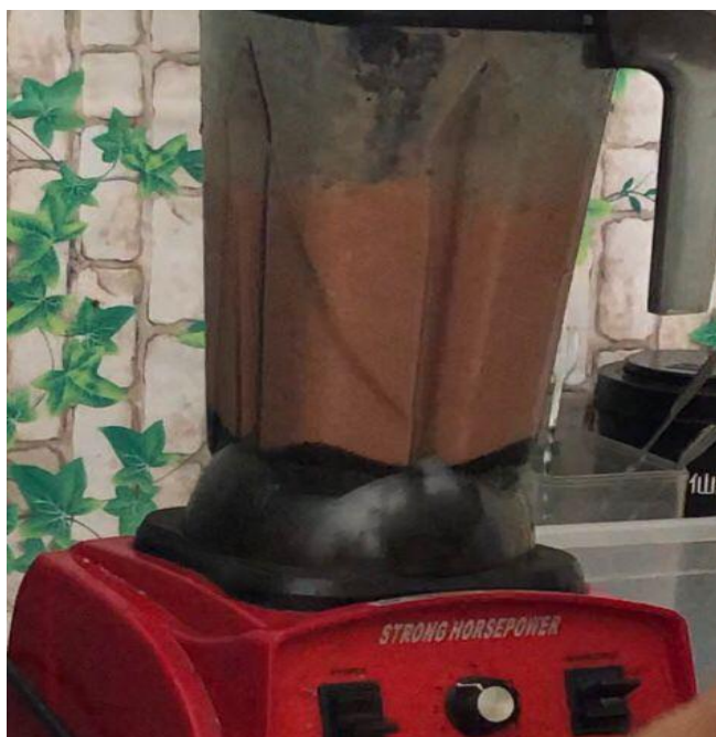
图3 将西红柿打成汁

硫酸 20% 准备一个 500ml 烧杯先接入 400ml 蒸馏水再倒入 100ml 硫酸,用玻璃棒搅拌稀释即可倒入试剂瓶中。